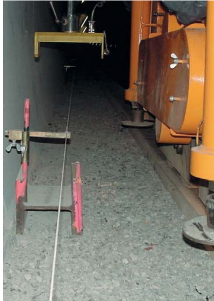
Bild 1: Gussasphalteinbau ab Draht mit dem Fertiger EB 100 S Linnhoff.

zungen der Holzunterlagen unter den Schienen zu Abweichungen von der Sollhöhe führen.